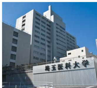
埼玉医科大学 大学病院

埼玉医科大学は建学の理念の第一として、「すぐれた実地臨床医家の育成」を掲げています。大学に隣接する埼玉医科大学病院の他、埼玉県内に3箇所の医療機関を持ち、質の高い臨床実習教育を実践しています。