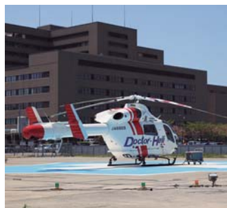
埼玉医科大学 総合医療センター