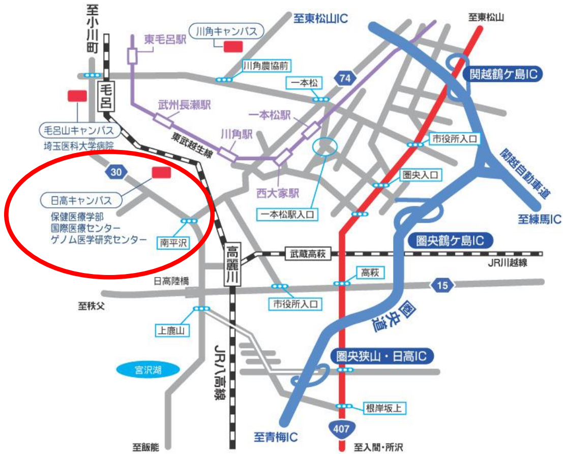
日高キャンパス構内配置略図 平成19年10月現在