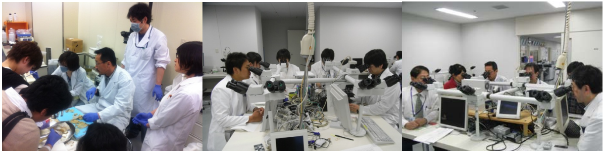
切り出し・診断のレクチャー、コンセンサスメETING

病理解剖があった場合には、研修医の先生は可能な限り参加してもらい、剖検を通して個々の臓器所見から全身的な病態を、あるいは全身状態から各論的事項を考察していく、他科では経験のできない修練が経験できる。ご遺体に対して敬虔な気持ちを抱きながら剖検に携わることで、医療従事者としての基本的な心構えを再確認する機会でもある。