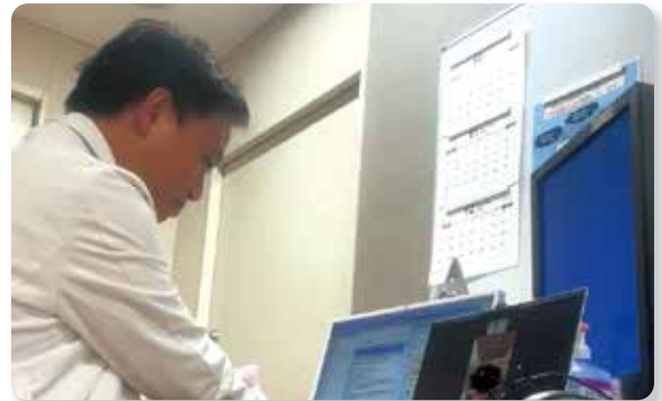
写真 実際のオンライン診療の様子