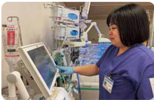
人工呼吸器の設定を確認している場面

新生児集中ケア認定看護師は、生まれたばかりの赤ちゃんのいのちを守り、健やかな成長発達を支える看護師です。NICU(新生児集中治療室)やGCU(新生児回復室)で、低出生体重児や呼吸・循環などのサポートが必要な赤ちゃんに対し、医師や多職種と協力しながら、安全でやさしいケアを行っています。