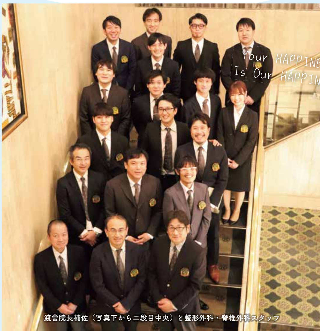
渡會院長補佐（写真下から二段目中央）と整形外科・脊椎外科スタッフ