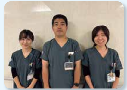
術前薬剤師外来担当者

術前薬剤師外来は、術前休止推奨薬剤の休薬不十分等に伴う手術の中止など薬剤に起因するインシデントの防止と周術期医療の安全性向上にも貢献できると考えており、今後も術前薬剤師外来を通して医師、看護師、医療事務などのスタッフと協力し、不安なく安心できる周術期管理・薬物治療を実践してまいります。