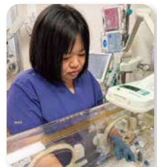
児のケアを行っている場面

これからも私たちは、「小さいいのちを守り家族を支える看護」を大切にし、埼玉医科大学病院のNICUから地域へ、赤ちゃんと家族の笑顔や安心が広がる活動を続けていきたいと思えます。