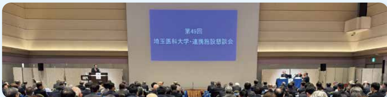
川越プリンスホテルにて会場開催風景