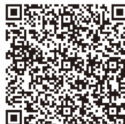
電話初診予約ご案内書

なお、患者さん自身で電話予約ができない場合は、お手数ですが、医療機関様よりご連絡いただけますようお願いいたします。